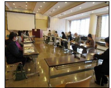
ディスカッション