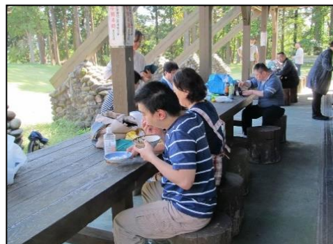
調理班の作ったとん汁で楽しい昼食