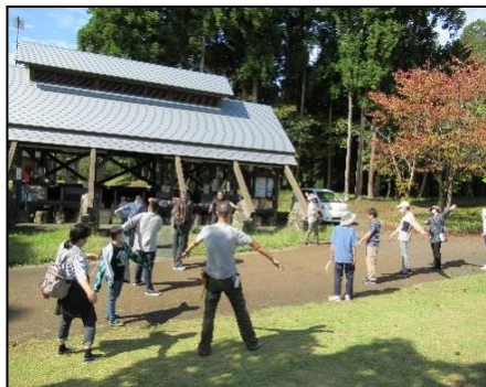
準備運動後ハイキング班と調理班に分かれて活動