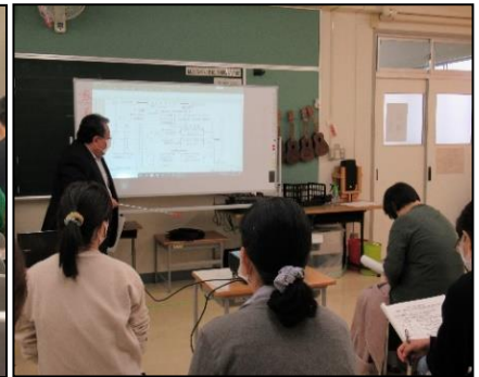
高特PTAよりの依頼講座